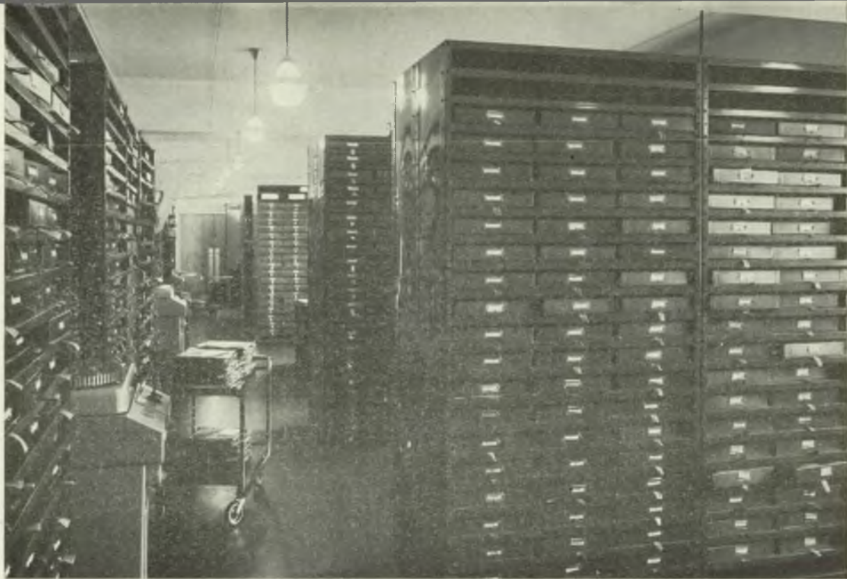
Een hoekje van de discotheek.