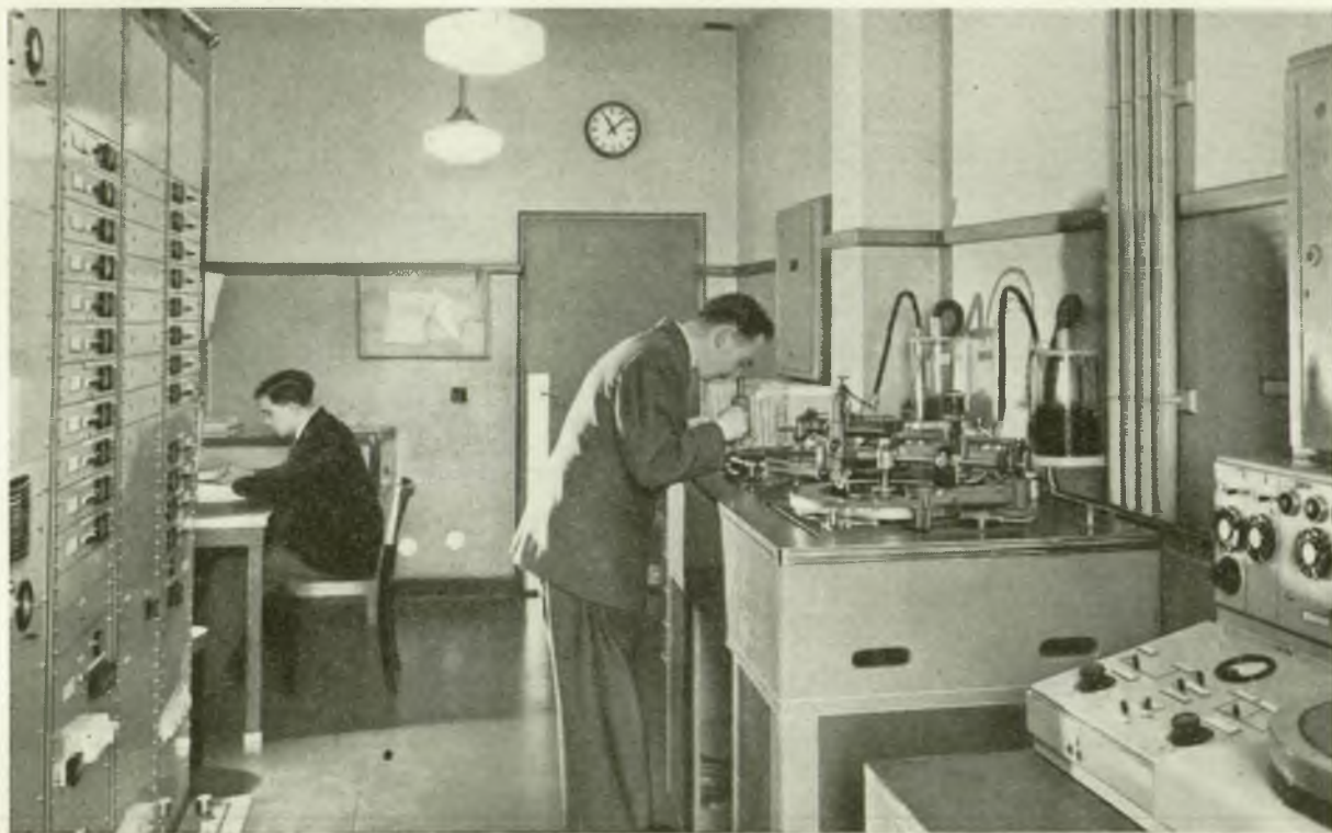
Een der lokalen war programma's op fonoplatten worden geregistreerd.