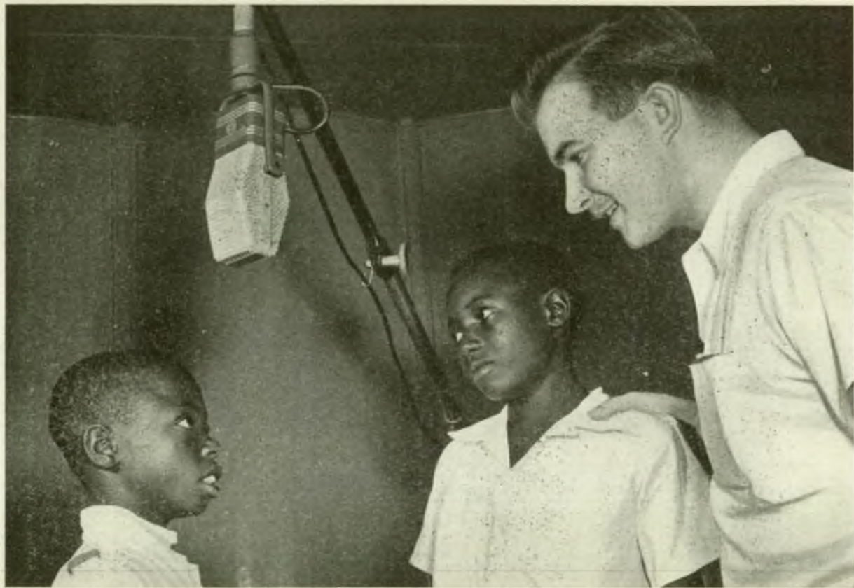
Een duplex-uitzendingen tussen de Belgische en de Kongolese Schoolradio