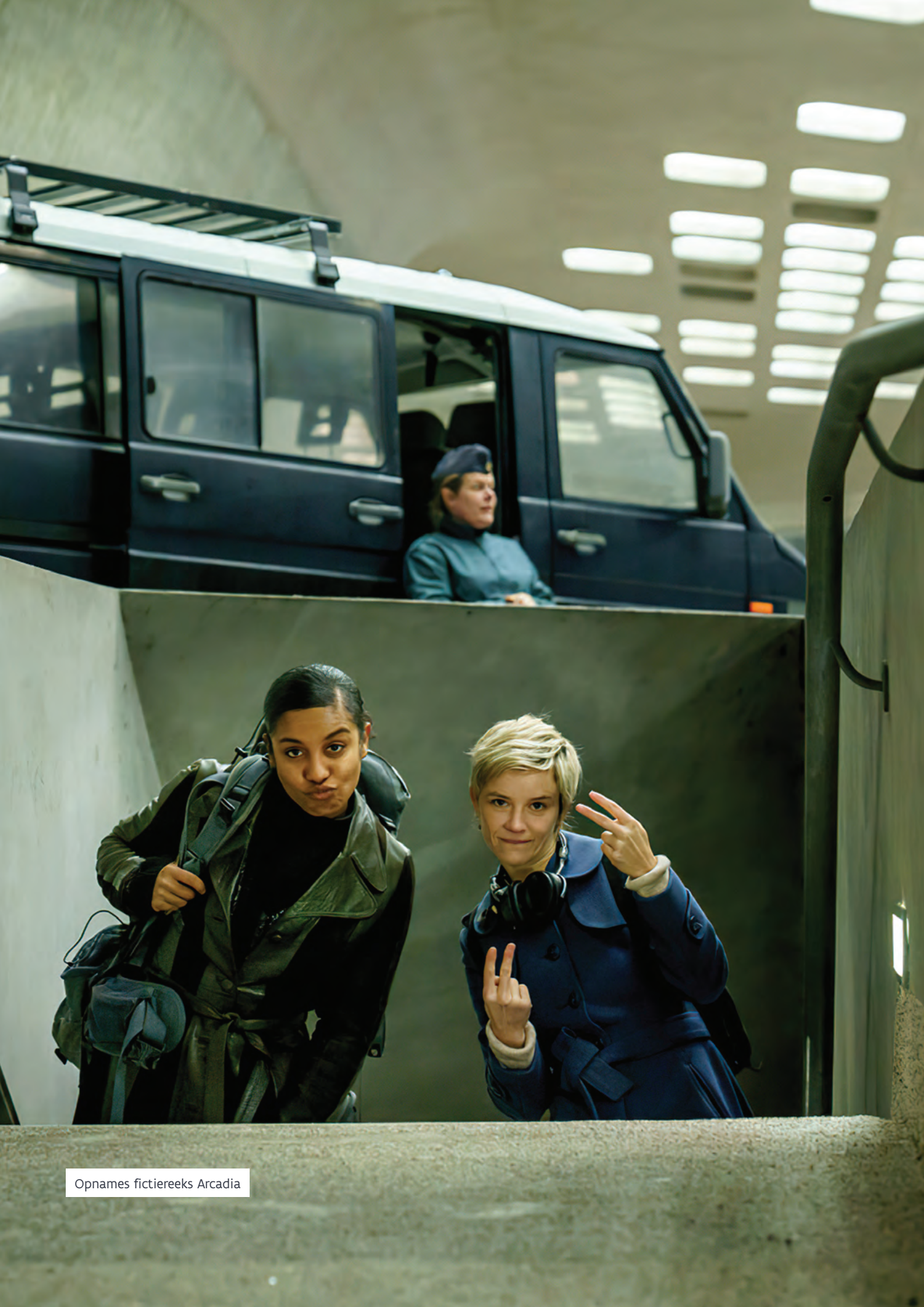
Opnames fictiereeks Arcadia