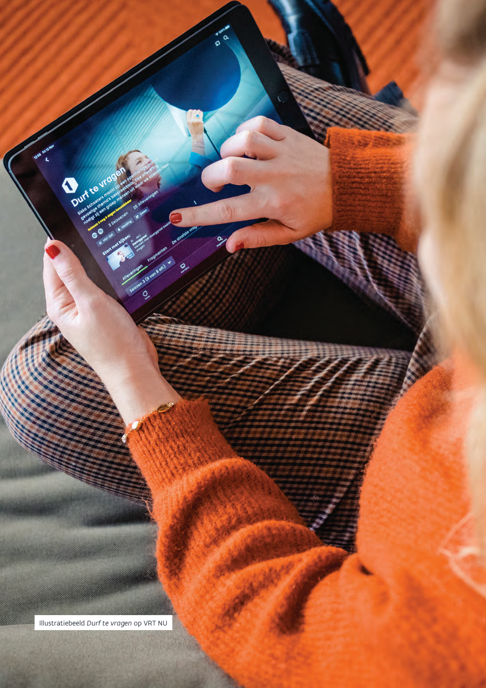
Illustratiebeeld Durf te vragen op VRT NU