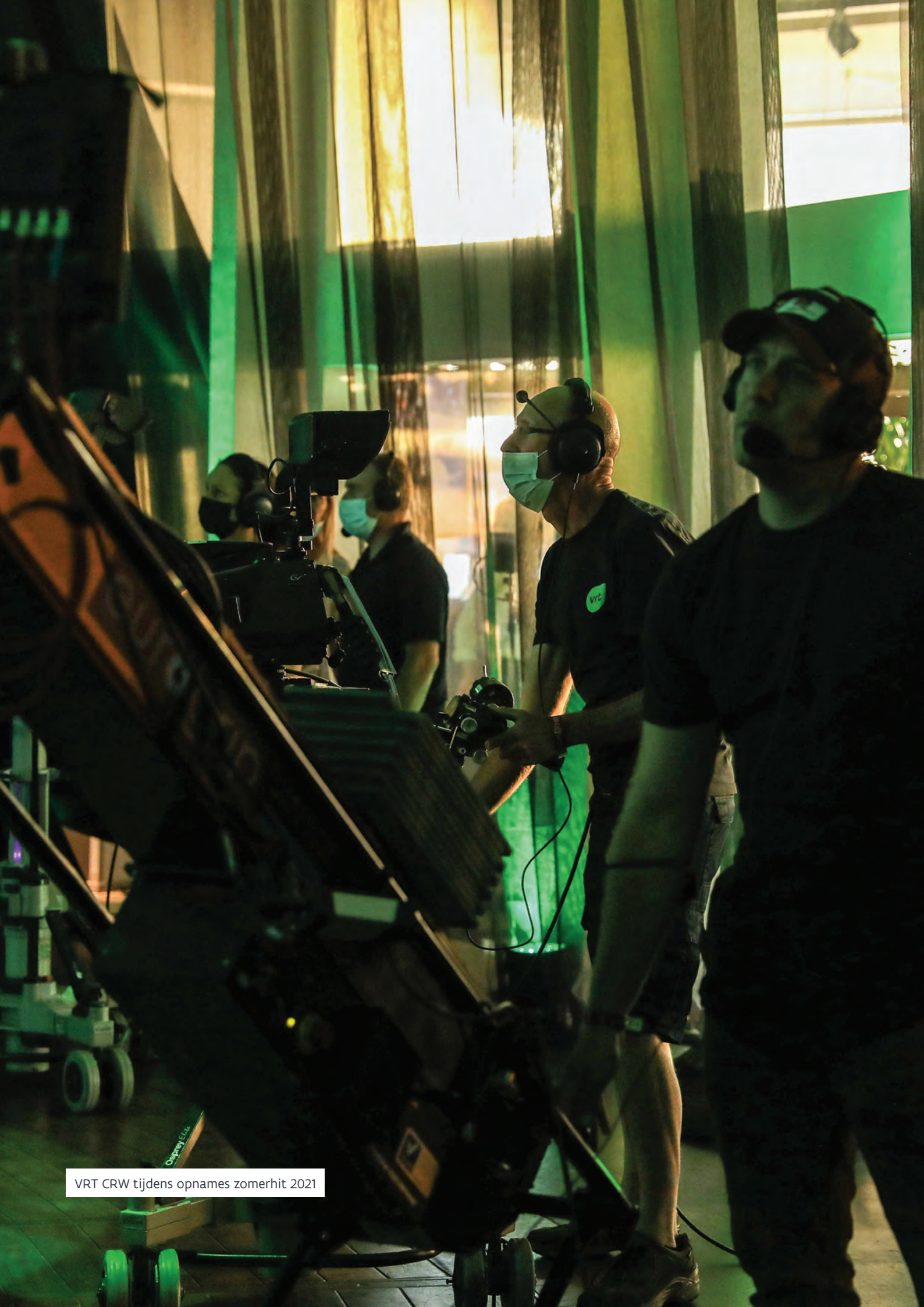
VRT CRW tijdens opnames zomerhit 2021