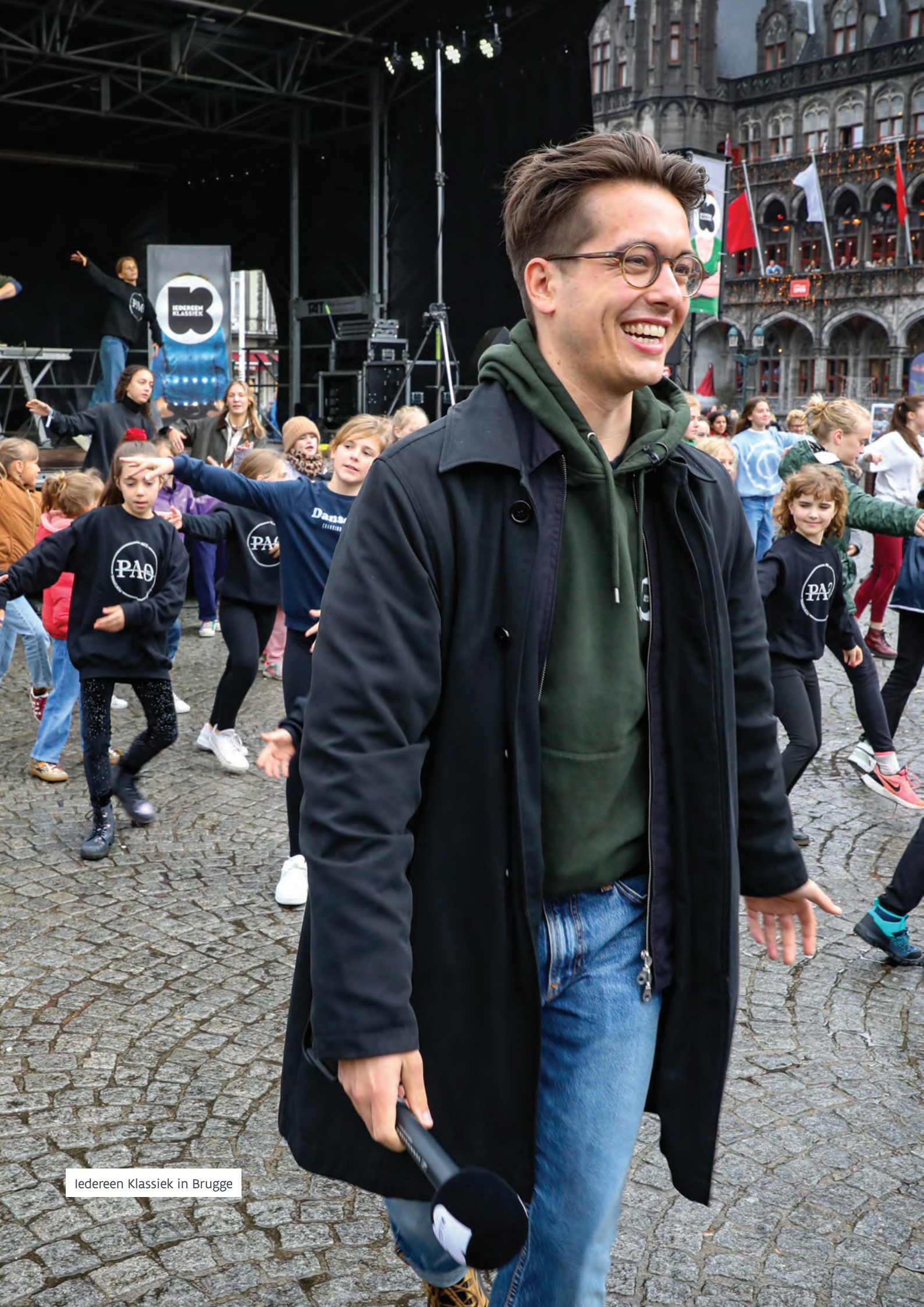
Iedereen Klassiek in Brugge